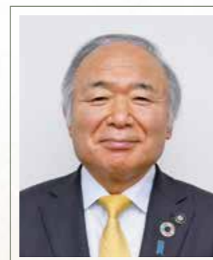
新潟県 糸魚川市長

第39回「全国削ろう会」は、世界有数のヒスイの産地であり、ユネスコ世界ジオパークに指定されている新潟県糸魚川市で開催致します。 参加者の皆様楽しんで頂けるように実行委員一同準備をしてきました。 沢山の方にご参加頂き、日頃培った匠の技を存分に発揮して、大会を盛り上げて頂けると幸いです。 終わりに、新潟県糸魚川大会の開催にあたり、地元糸魚川市をはじめ関係団体、各位のご支援、ご協力のおかげで大会が開催出来ますことに心より御礼申し上げます。