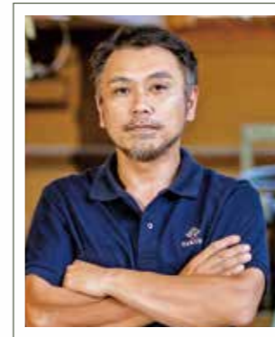
第39回全国削ろう会 糸魚川大会 実行委員長

第39回全国削ろう会糸魚川大会の開催おめでとうございます。 日頃より会員をはじめ、参加者の皆様におかれましては、削ろう会の活動にご理解、ご協力頂きありがとうございます。 さて、削ろう会は、鉋での薄削りを通して、木工手道具の取扱い技術の向上、伝統技術の継承を目的に全国各地で技術交流をしております。 当地糸魚川市は、国石・翡翠のまちであります。新たな出会いや文化、当地の豊かな風土にも触れながら削ろう会糸魚川大会を楽しんで頂ければ嬉しく思います。 参加者皆さまのご健闘と、糸魚川市の更なる発展をご祈念申し上げ挨拶と致します。